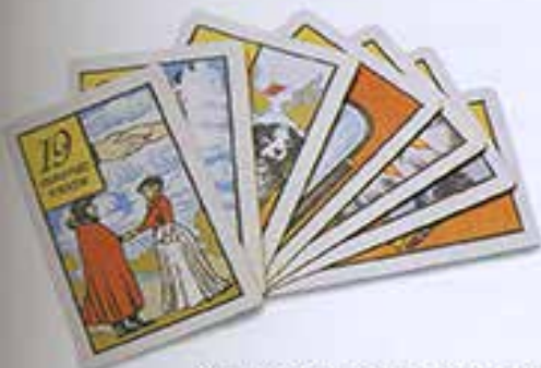
Cartas originales de la antigua baraja de adivinación gitana, publicadas por Whitman Publishers.

Normand, una adivina y creadora de barajas. Le Normand es conocida por sus famosas predicciones sobre la vida de Josephine Beauharnais. Cuando Josephine era una joven viuda, Le Normand le leyó el futuro en las cartas y anunció que conocería a un soldado, se casaría con él y que, más adelante, la coronaría emperatriz. Ese soldado era Napoleón Bonaparte. En 1807, Josephine convenció a Napoleón para que Le Normand le leyera la mano, quien predijo su divorcio y contó detalles sobre su carácter y sus gustos. Napoleón pidió a Le Normand que lo pusiera todo por escrito, con lo cual entregó el documento a la policía y, el 11 de diciembre de 1809, hizo que la arrestaran. Le Normand permaneció detenida durante doce días al tiempo que Napoleón obtenía su divorcio.